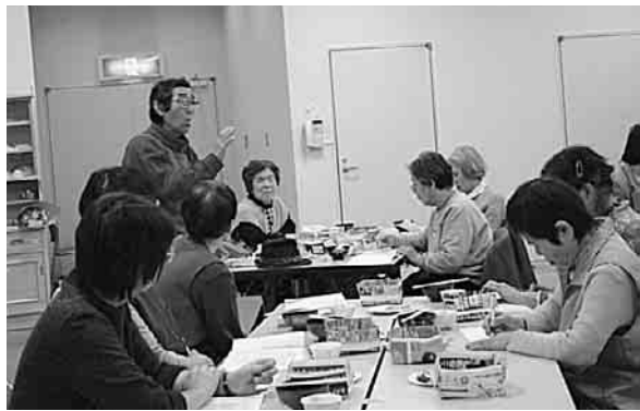
積極的な意見がたくさん出て

名が一一五一通(全体へ誘って成功させている経験、会話の中で、特に高齢者には大変な手配りの時に、班会「ごみ出し」を毎回手配っているという、心温まる話も出ました。「部数が多く、配ることで精一杯。声をかけるゆとりがない」「発行が不定期で、終わった行事の案内など入っている時もある」といいます。 率直な発言も。年々、手配りに参加している人は減っています。高齢化が主な要因ですが、今後は会報で呼びかけるなど工夫しながら手配りする人を増やすこと、配布する地域の整理、無理がない数配布する、手配りする時の声かけなどの改善が必要だと思いました。 一人ひとりの努力と協力が大きな励みになり、友の会の発展につながると思っています。楽しみながら手配りが出来るといいですね。自分の健康の一部として手配りしていきたいと考えます。