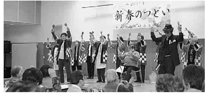
鳴子を鳴らしてにぎやかに

乾杯の後、会食しながら歌や踊りを楽しみました。おしゃべり喫茶に参加している方たちのお出し物は『よさこい鳴子体操』。半被姿でこの日のために特訓した成果を披露。心地よい鳴子の音とよさこいの曲につられ、会場でも一緒に身体を動かした。