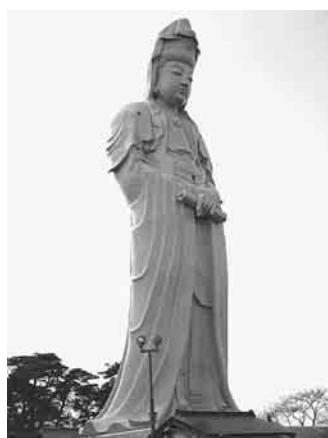
現れる。長屋門をくぐり、かつての良き時代の古民具にその温もりを感

一月二十八日、定刻行を迎えてくれる。その過ぎることなく出発のやさしさと美しい姿を見た大型バスは、二十九人の乗客と共に一路目的地へと向う。北側の斜面に雪を頂いた山懐にかやぶぎの民家が現れる。長屋門をくぐり、かつての良き時代の古民具にその温もりを感