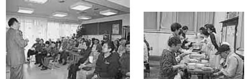
昨年の健康まつり

2007年3月18日(日) 午前10時～午後3時 入場無料 会場 練馬第一診療所(待合室、駐車場)、ねりまヘルパーステーション、平和台薬局 メイン会場 記念講演 マリンノ演奏やけん玉 他の会場 健康チェック(血圧測定、体脂肪測定、貧血チェック) ● 健康相談 歯科、くすり、育児について模擬店など ● 包丁とぎ ● やきそば、喫茶コーナー 主催 練馬健康まつり実行委員会 連絡先 練馬第一診療所03(3933)89 立川