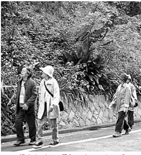
緑をながめて元気にウォーキング

●今年の桜は早く咲いたり遅くなったり予報も迷い気味でした。選挙の一票は迷ってなんかいられない。生活と平和を守る政党に必ず入れます。(Y・Hさん)