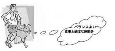
バランスよい食事と適度な運動を