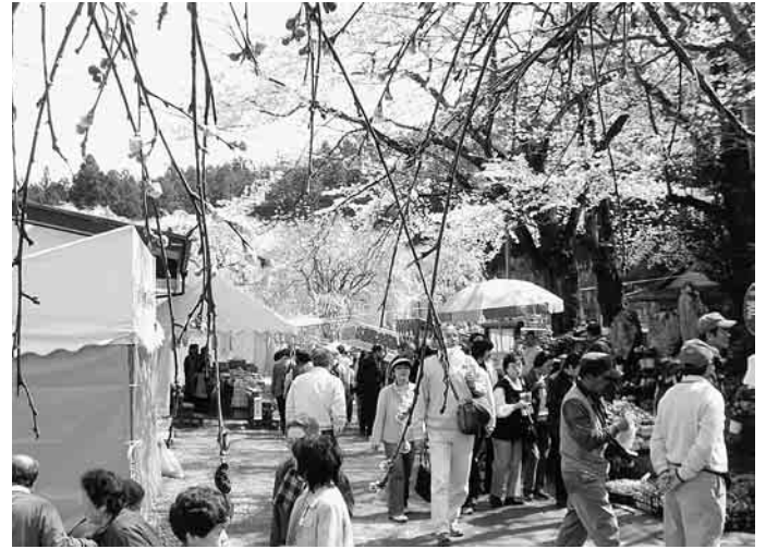
みごとな桜に観光客が多勢