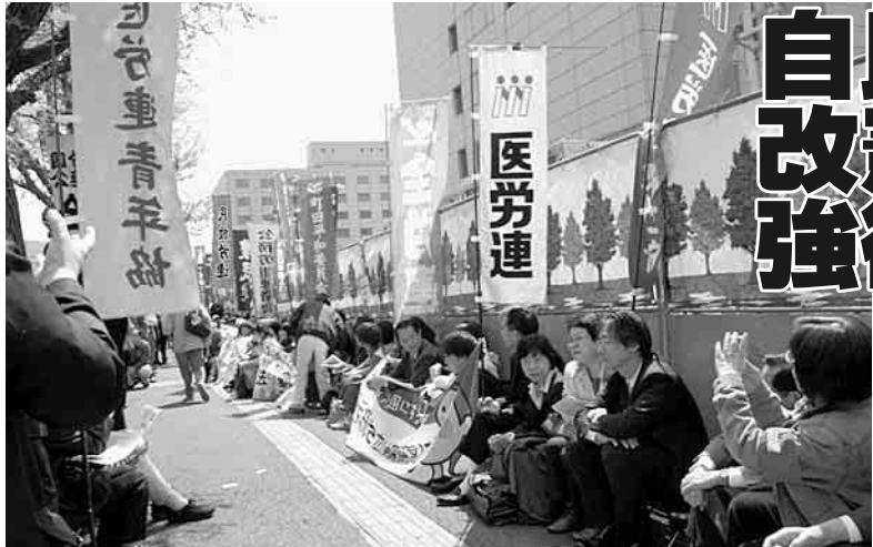
4/12全国から1700人が廃案求めて国会前ですわりこみ