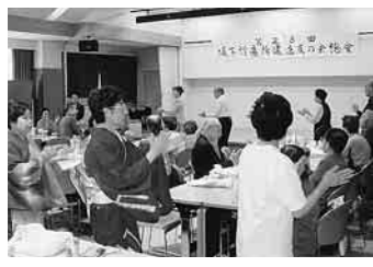
踊りの輪をみんなで

風邪をひいたときは、まわりの人に迷惑をかけないために、マスクを着用しましょう。また、マスクをして