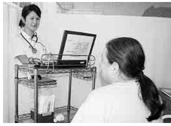
入院患者さんの横で記録を入力

約二年間の準備を経て十一月から始動し、一ヶ月がたちました。電子カルテの導入の目的は、①医療の安全性を高めること。患者