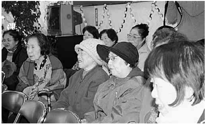
安心してかけられる医療制度に(本文とは直接関係ありません)