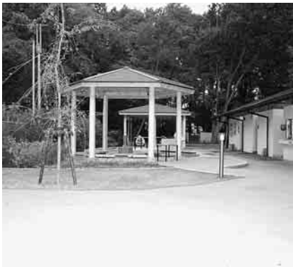
今日は西武新宿線上で遠出しました。出発は、都営三田線の本蓮沼

駅。巣鴨駅でJR山手線に乗り高田馬場駅へ。そこから西武新宿線急行で東大和駅へ。所要時間は本蓮沼駅から一時間位(乗り換え時間も含む)。東大和駅前降り立つと右前方には「東京都薬用植物園」があり、無料で入園できます。園内には一六〇〇種類もの薬草が植えられているので、都会ではめったに見られない山野草もあり、故郷の匂いにしばし浸りました。マスコミを賑わす大麻