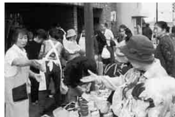
掘り出し物はあるかな

穏やかな天気にも恵まれ、早朝からはりきって準備に取りました。お客様も品物を並べると古いが出てきました。作者の名前の入った箱入りでした。「これは鑑定したら値打ちのあるものかもしれない」と言っている人もいました。衣類コーナーでは、脱いだり着たりでワイワイと賑やか