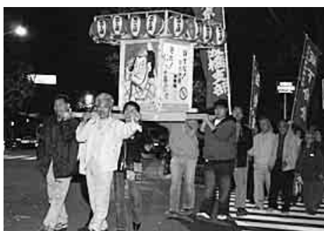
東京土建板橋支部のみこしでパレード