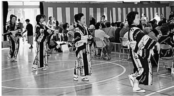
会場全体で楽しむ