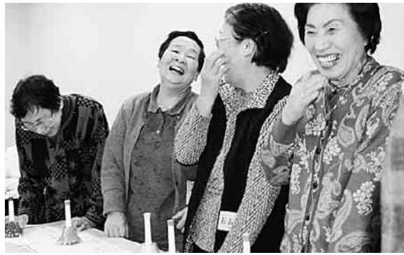
長生きしてよかったといえる制度に(本文とは関係ありません)