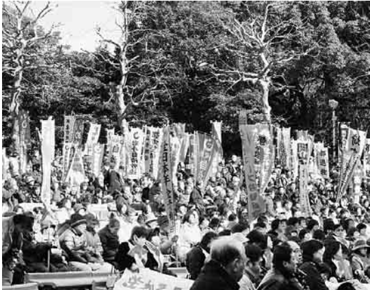
会場には全国から駆けつけぎっしり

発行：東京民主医療機関連合会 北中ブロック城北地域診療圏協議会 編集：医療と健康のひろば編集委員会 〒174 8502 東京都板橋区小豆沢1 6 8 健康文化会内 電話03 5994 0271 ファックス同上(自動切替) 2008年3月 第102号