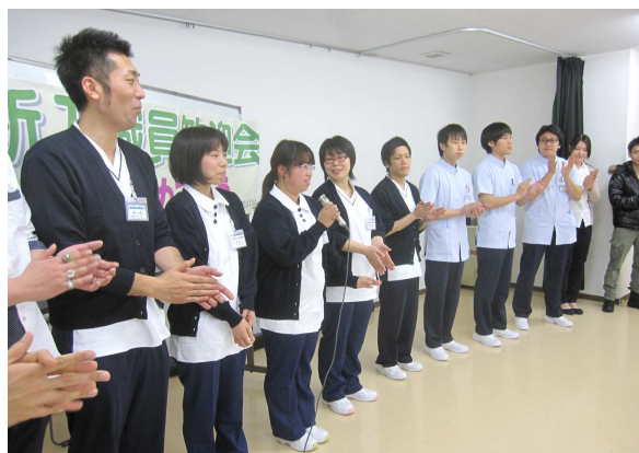
↑研修の後は、看護部で歓迎会を行いました。ピザやサンドイッチで盛り上がりました↑