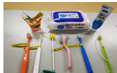
口腔ケアに使う用具の紹介

今後も私たち地域医療連携センターは、地域連携交流会を定期的に開催し、当院で取り組んでいる医療内容のご紹介や、参加者の要望等を踏まえて学習会の提案を行なっていきたいと考えています。