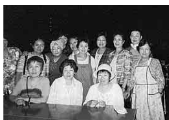
平和が大切ねと参加したみなさん

かと迷っていましたが、時間が近づくにつれて雲が少しずつとれてきて、駐車場で行いました。