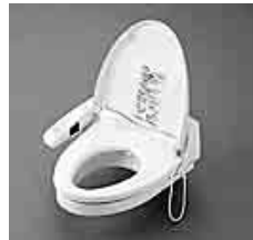
ウォッシュレット付補高便座

膝に痛みがある、膝が曲がりにくいなどの症状の方は、トイレの便座が低すぎて起座動作が困難になる場合があります。また、トイレの出入り口の段差をなくすために、床を高く上げた際に、便器が低くなってしまふことがあります。