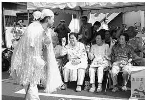
玉なげゲームで笑顔が...

余興がなかなか決まらず、実行委員会全員が不安でしたが、三味線と太鼓に決まり、ほっとしました。