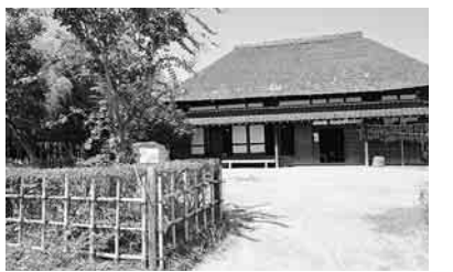
古民家でのんびりと

堤防上のサイクリングロードを自転車で行くと五分程走ると鹿浜橋です。橋を渡り左手に折れると「足立区都市農業公園」があります。電話〇三(三八五三)三七二九