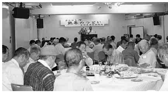
熱心に聴く東京土建板橋支部のみなさん

また、作業衣は軽く洗ってから濡れたまま持ち帰るようにはしないう。禁煙し、健康診断を毎年受けることが重要です。