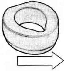
補高便座(取り外し型)