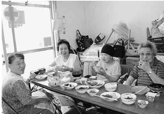
練馬第一診療所健康友の会の高齢者お食事会 「みんなで食べるとおいしいね」おしゃべりもはずんで

税も検討されています。平和の問題でも、憲法九条を変え、アメリカのいいなりに戦争をする国にしようとしています。