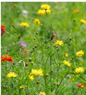
散歩会・浜離宮で撮影