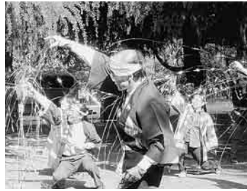
パワフルに職員の出しもの

光が丘公園の銀杏並木通りの一角で、友の会の方やボランティアさんの協力で在宅患者さんたちと三時間の喜びを共にしました。当日は、お日様も笑顔を見せてくれたので、急遽、外で行うことになりました。バラ園の散歩、唄やよさこいおどり、沖縄の舞踊など出し物が盛りだくさんで