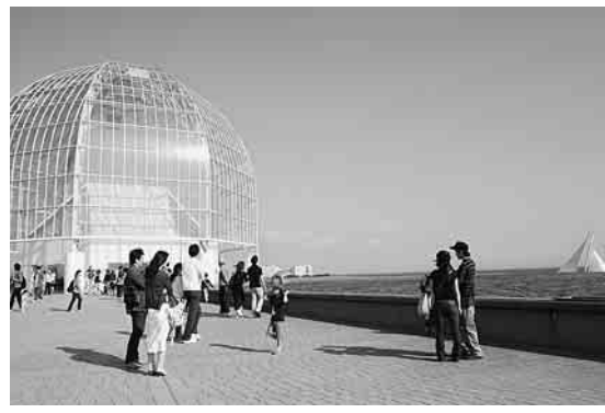
海のすぐ前にある葛西水族園

JR東京駅から京葉線で十五分。磯の香りがたつ「葛西臨海公園駅」があります。徒歩五分で、葛西臨海公園があり、水族園と鳥類園があります。葛西臨海水族園・ドーナツ型の水槽では、クロマグロなど世界の生き物、約二五〇種類が泳いでおり、訪れる人を楽しませてくれます。小学生以上の磯の生き物観察会や水族館オリエンテーションなどのイベントもあるの ・開園時間午前九時三十分～午後五時(入園は午後四時まで) ・入園料