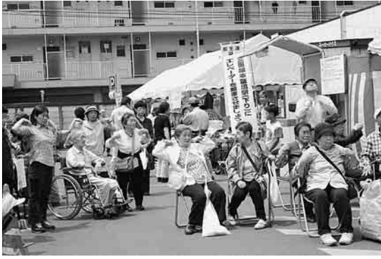
体操をみんなで元気に