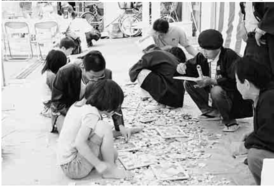
親子でモザイクタイル作りに挑戦!!