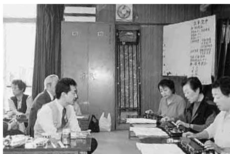
第2部交流会で「大正琴の演奏」

当日は、快晴に恵まれ、待ちかねたように桐ヶ丘E1集会場にそれぞれに会員がやってきました。