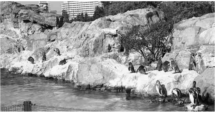
かわいいペンギンなど世界の海の生き物が楽しめる