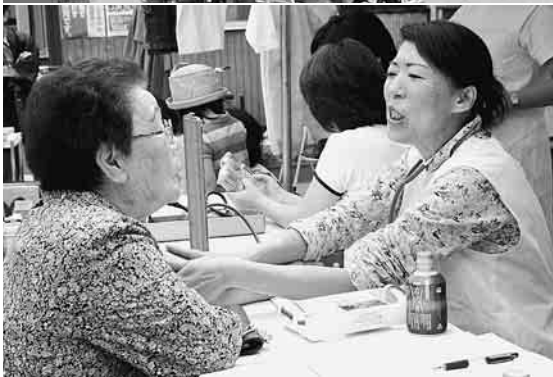
血圧測定コーナー「心配することないですよ」