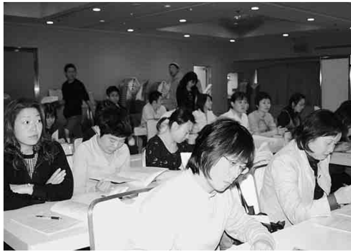
真剣に聞きいる集会参加者たち

北中ブロック(練馬区、北区、板橋区の民医連)医療活動交流集会が板橋文化会館で開催され、二百四十人が参加しました。はじめに記念講演を「国境なき医師団日本支部・副