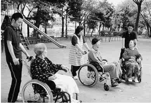
緑の中を近くの公園まで散歩