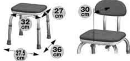
① 従来のものは、幅が43～44cm、奥行き48～50です。

入浴用イス（シャワーチェア）には、簡単なベンチ型から背もたれや肘掛けがあるもの、肘掛けが跳ね上がるもの、車いす機能を兼ねたもの（シャワーキヤリー）などたくさん