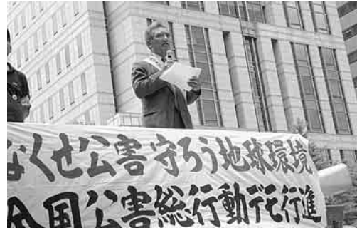
野繁さんの上で訴えるのの状況で回復の見込みはありませぬ。なんの救済も受けていない被害者は、高額な医療費を負担できませぬ。必要な治療を受けられず、失業して生活保

東京大気汚染公害裁判 原告団は原告九十九名中、九十二名の救済を拒否した二〇〇二年十月のあのくやしい第一次判決を乗り越え闘っています。東京デューゼル排ガスによる大