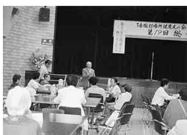
来賓で挨拶する高嶋先生