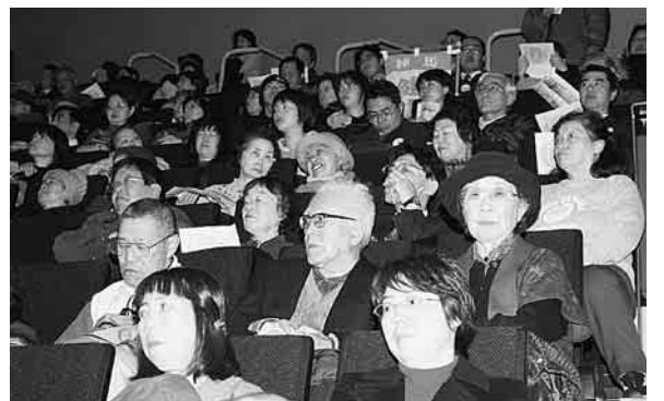
友の会からもたくさん参加

・社会的格差の進行や平等であるはずの命が危ない!これ以上の国民いじめは許せない。医療従事者として患者様の現状や気持ちに訴えてながら、微力でも頑張っていきたい。 (職員・女性・四十代) ・北海道や長野県の松