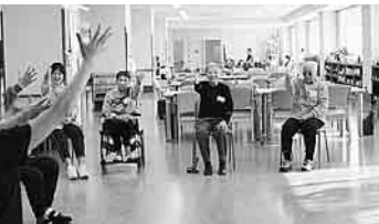
志村さつき苑通所リハビリテーションで(特に記事とは関係ありません)