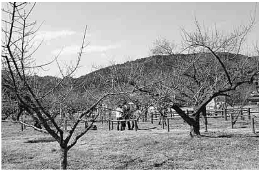
まだ梅のつぼみ(2/18)でも3月は満開に...

今年の冬は寒さが厳しい冬でした。既に訪 この梅林は、関東三大梅林に数えられおり、今から六百年前、九州大宰府から菅原道真公を祀って梅を植えたのが初めとされています。園内にはさまざまな種類の梅の木が約千本あり