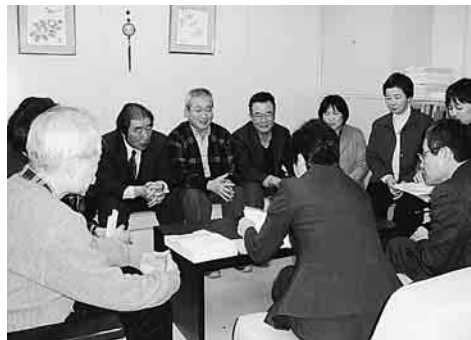
2/10 板橋社会保障推進協議会が板橋区に有料化しないように要請