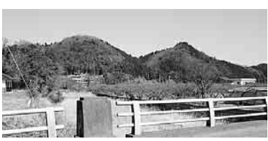
周りの山々も絶景です

奥にバスで十五分のところに黒山鉾泉や黒山三滝があるので足を延ばしてみても如何でしょうか。