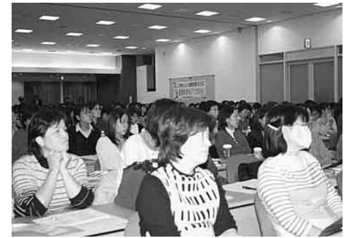
参加者みな同じ想い-12/3看護フォーラムで

看護師を辞めようかな...突然辞めて海外にでも逃亡しようかな...と何度か思いつながら働