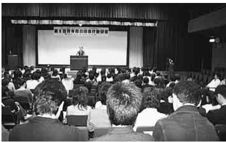
全体で学習しました

「医療や福祉の職業はやりがいがある仕事で、もしかすると、患者さんの人生の登場人物になれるかもしれない。すばらしい仕事ですが、苦悩も少なくないし、大変です。今の患者さんたちの置かれて