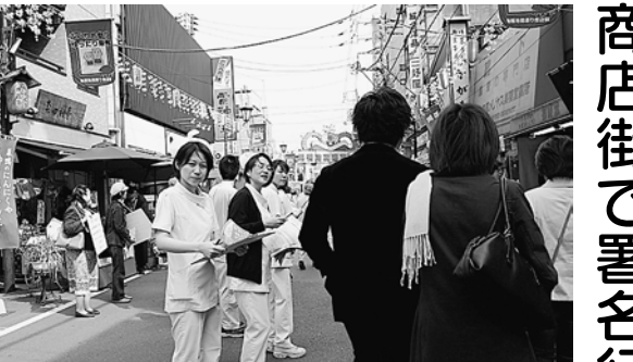
白衣姿は買い物客の目を引いて