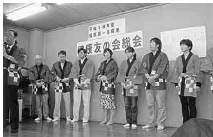
職員も参加して交流

総会は、北町第二 区区民館で開催し、五 長の乾杯の音頭で始ま り、子育て交流会の可 愛い子どもたちの元気 挨拶、来賓の挨拶があ りました。その後、 活動と会計の報 告、本年度の十項 目の方針、会計の 提案を行い、質疑 応答を行い、満場 一致で可決しまし ました。また、新年度 の役員の提案があ り、全員承認され ました。