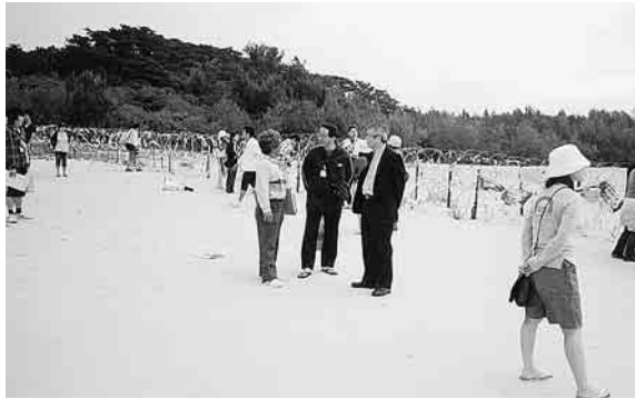
基地建設予定地は鉄線がはりめぐらされ

じめ船に乗り、キャン プシユワプを見なが ら、長島という島に行 きました。そこで、基 地反対運動をしている 地元の人々の説明を聞き ました。「このきれいな 海に、基地が移転し てくることは反対で す」と強く 語っていました。 建設 予定地にキ ヤンプシユ ワプの一部 も入ってい て、現在建 設中の建物 を壊して新 たに基地を 作るように しているそ うです。その 話に、とて