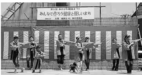
志村さつき苑の職員によるおどり