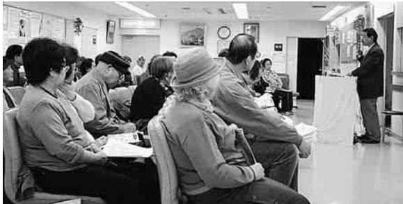
趣味などを生かし、楽しむことも予防です。

②非薬物療法 認知症の人に生きていくことを実感してもらい、残された機能を維持させ向上させるものです。