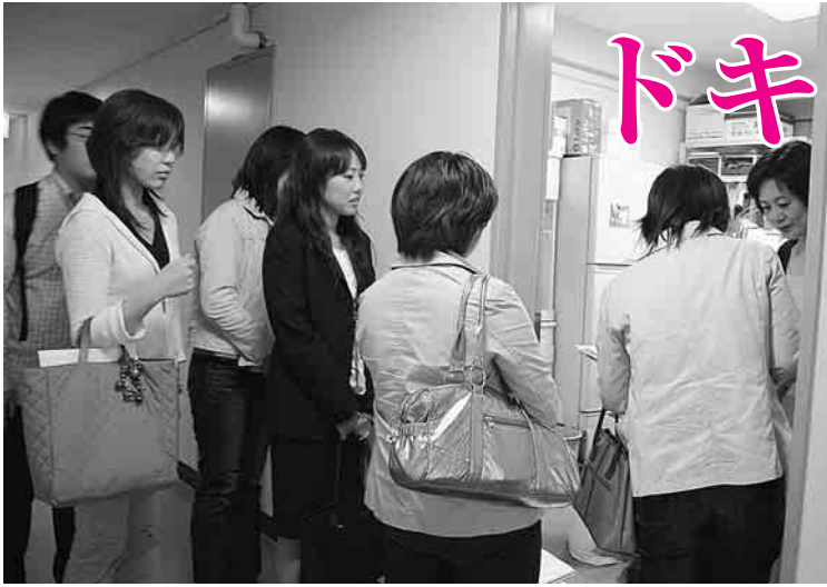
一人ひとり自分のことばで伝えました