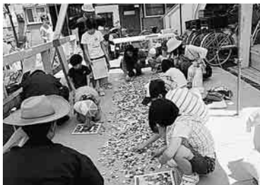
モザイクタイルコーナーで子どもは夢中

四月から介護保険が変更されたんだねとよく質問されます。心配だなぁと。要介護一の方は、ベットと車椅子利用することができなくなり、自立とみなされ、ベット無しで筋力をどんどんつけてくださいということになります。四月から介護保険が変更されたんだねとよく質問されます。心配だなぁと。要介護一の方は、ベットと車椅子利用することができなくなり、自立とみなされ、ベット無しで筋力をどんどんつけてくださいということになります。