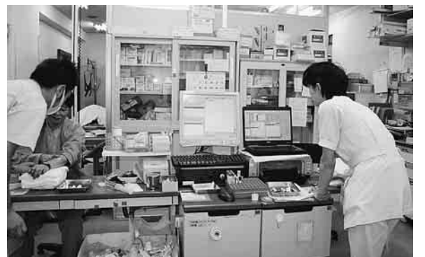
患者さんの情報の共有と納得の医療へむけて