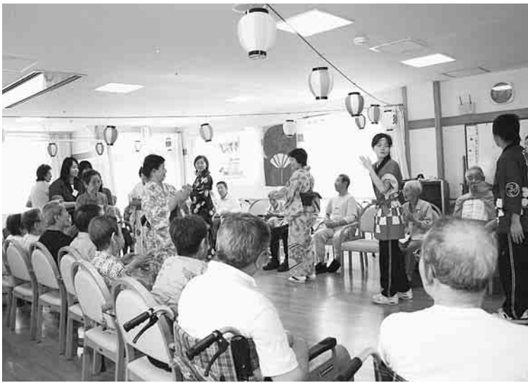
誰でも安心できる介護保険制度に。小豆沢病院デイケアの夏まつり(本文とは直接関係ありません)

介護保険が改悪され、四月から新たに予防給付が加わり、要支援認定の利用者が要支援一、要支援二に細分化されました。要支援の方の介護予防プログ