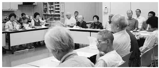
憲法九条の大切さを改めて納得

毎年暑い夏を迎える と、ヒロシマ・ナガサ キ、そして終戦記念日 など戦争で犠牲になっ た人々の霊を弔い、二 度と戦争の惨禍の無い 世界を創ろうと誓っ た事、世界で行なわれ る「ことを活動の柱に す。