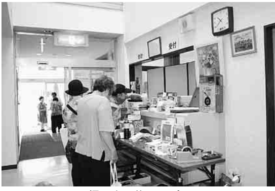
掘り出し物いっぱい

八月二十三日には原 水爆禁止世界大会の報 告会「平和の夕べ」と 銘打って納涼会を参加 者五十名で開催しまし