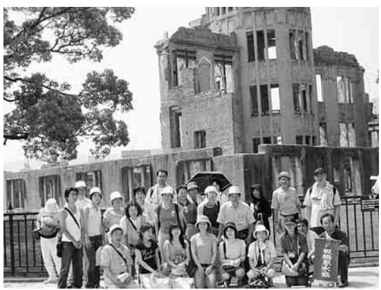
史跡めぐり。板橋代表团で

二〇〇六年原水爆禁止世界大会(広島)に健康文化会・ユニオン企画から代表として八名参加しました。四名の感想を紹介します。