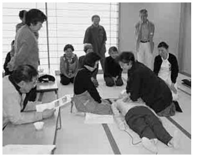
心臓マッサージの練習 「なかなかむずかしいネ…」

漂白剤)：食道粘膜にひどいやけどを起す ・ガソリンや灯油：気管へ吸い込み重い肺炎を起こす ・飲み込んだものはつきりしない場合や口や喉がただれている場合