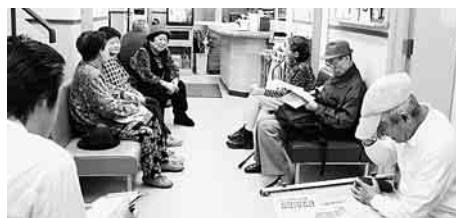
「どう調子は」と体調を気づかいながら入会も訴えて

待合室で役員と職員 がお誘いし、早速六名 が快く入会しました。 地域への訪問行動もし ています。