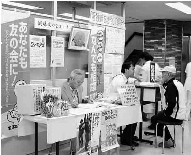
小豆沢病院の相談コーナーと友の会入会コーナー

発行：東京民主医療機関連合会 北中ブロック城北地域診療圏協議会 編集：医療と健康のひろば編集委員会 〒174 8502 東京都板橋区小豆沢1 6 8 健康文化会内 電話03 5994 0271 ファックス同上(自動切替) 2006年11月 第89号