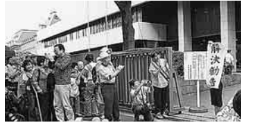
まちわびる参加者に決定を伝えた瞬間