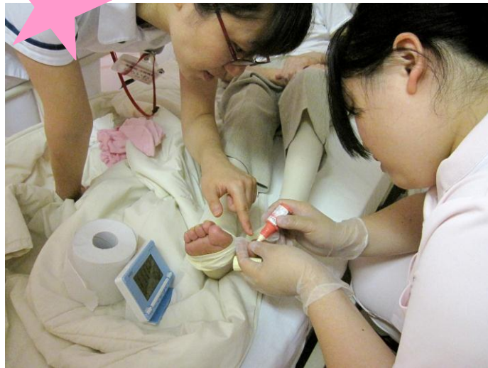
足爪白癬の薬を塗布しています