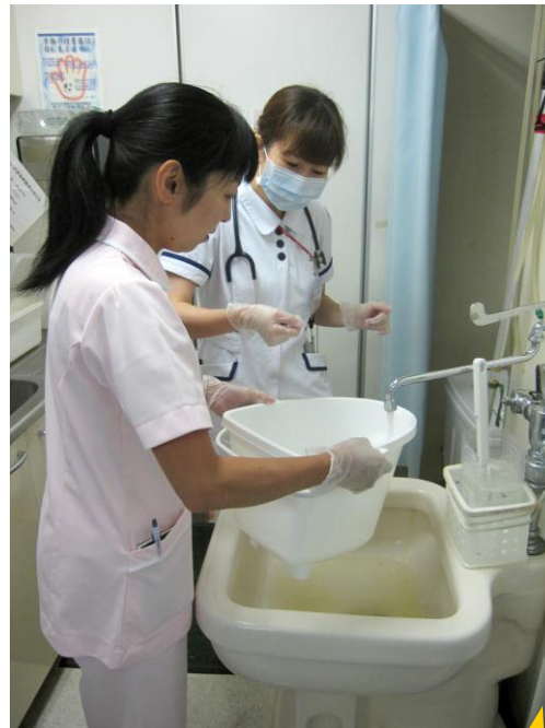
ポータブルトイレの処理しています