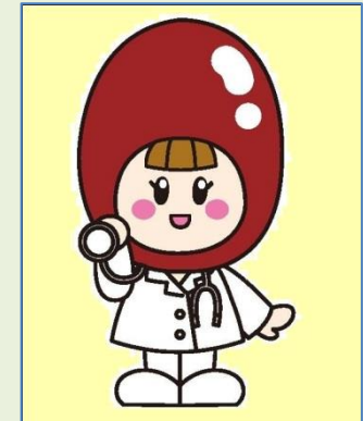
小豆沢病院 キャラクター DR あずき